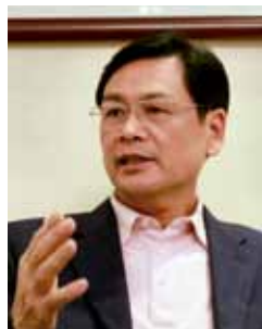
▲ 陈云贤 广东省副省长，广发证券创始人

2011年7月29日，广东省第十一届人大常委会第二十七次会议上，陈云贤被任命为广东省人民政府副省长，分管科技、教育、金融、知识产权等工作。无疑，陈云贤迎来事业的一个新起点。而对于广东，这片他服务了21年的热土，也面临着一场脱胎换骨的重大转变：产业升级、经济转型。改革开放之后，广东励精图治三十载，成为“世界制造业加工基地”；2008年金融风暴中，广东利用危机冲击形成的“倒逼机制”开始调整产业结构的步伐；数年过去，面对新一轮国际经济形势的风云变幻，广东产业升级转型路在何方？陈云贤，这位才履新一年余的学者型官员，将交上一份怎样的答卷？