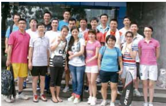
▲ 参赛选手合影留念

2012年9月8—9日，北京大学广州校友会在华南师范大学体育馆成功举办了“北京大学广州校友会第一届校友羽毛球比赛”。