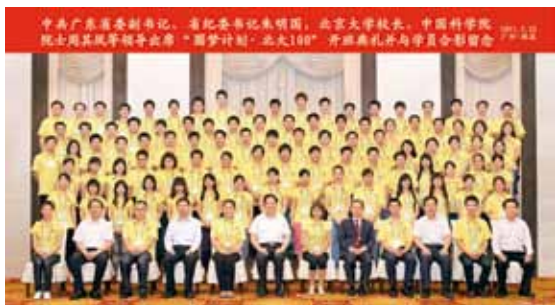
▲ 周其凤校长在圆梦计划开班典礼上致辞

2013年1月1日，北大广州校友会近60位校友参加了海珠湖徒步活动，并送上了新年的祝福。在温暖的南国，校友们畅游了广州市内的全程约11公里的海珠湖。