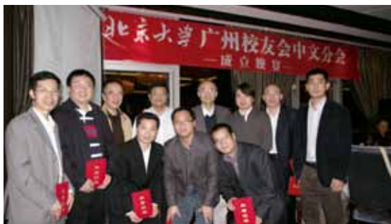
▲ 校领导与中文分会负责人合影

2012年11月25日，北京大学广州校友会中文分会举行了成立晚宴，北京大学常务副校长吴志攀，北大宣传部部长、中文系党委书记蒋朗朗，北大广州校友会执行会长徐枢等嘉宾出席晚宴并致辞，代表母校及广州校友会向校友们致以亲切问候，在穗广州校友济济一堂，珠海、深圳、佛山、揭阳等各地在粤校友也到场祝贺。