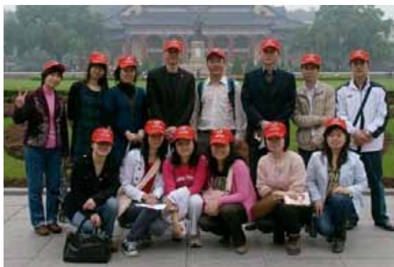
▲ 参与亚运会城市志愿者服务校友合影

2012年4月18日，北京大学广州校友会校友参与亚运志愿者体验日活动正式启动。期间，共有30多名北大校友在中山纪念堂、北京路步行街亚运会志愿者城市服务站参与活动。校友提供的志愿服务包括翻译、引路、礼仪服务等。