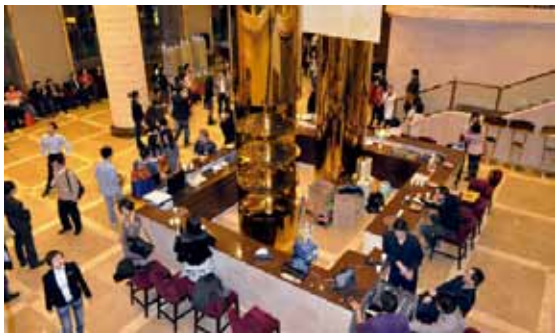
▲ 单身派对活动现场

此次活动，《南方日报》、《南方都市报》、《羊城晚报》、《信息时报》等主流报纸及新浪网、人民网、网易等门户网站报道了此次活动，在广州地区取得了巨大影响，反映热烈。