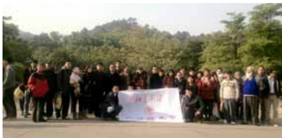
▲ 新春联谊活动合影

北大人校友、也有老中青校友、更有校友携一家大小参与活动。活动内容主要有爬山、自行车、羽毛球、乒乓球、网球、保龄球、篮球、桌球、棋牌、桌游等。