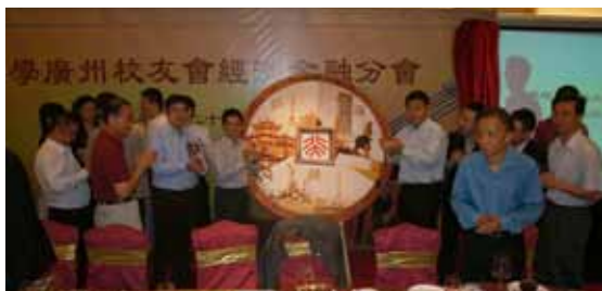
▲ 沪穗深三地北大校友金融圈标志揭牌

2012年10月28日晚，北京大学广州校友会经济金融分会举行了成立晚宴，北大校友会名誉会长、江苏省省委副书记、原北大党委书记任彦申、北大经济学院院长孙祈祥等嘉宾出席了晚宴，代表母校向校友们致以亲切问候。