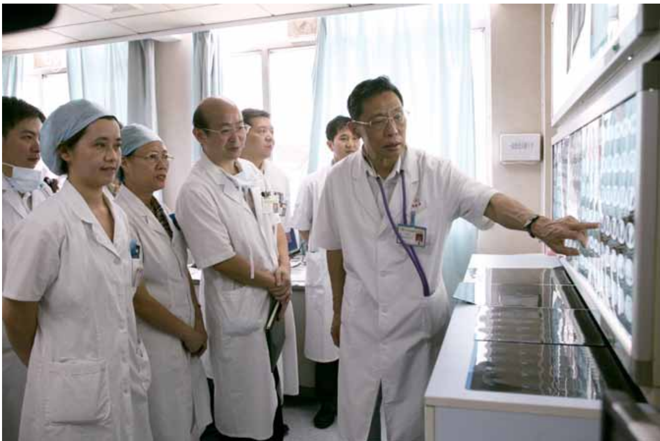
▲ 钟南山在门诊给学生分析患者病情

山获得了网民“良心哥”的赞誉，但他对自己的评价则只是“合格”，原因在于钟南山觉得，作为人大代表应该积极花时间调研，考察，而自己近几年这方面做得尚不够。这番朴实无华的反省，是一位七旬老人的自谦，也是一位尽职人大代表的赤诚之心。