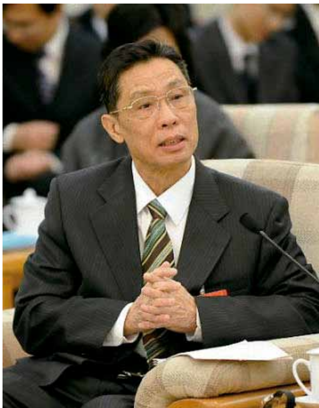
▲ 钟南山在医改讲座上发言

在非典型一役中，真正让钟南山声名鹊起的，应该是病原体之争中他那实事求是、不畏权威的科学作风和严谨有理的精准判断。当时，北京国家疾病预防控制中心认为衣原体是“非典”的病因，当时各大媒体都是一片“病因查明，形势大好”的声音。但钟南山及其同事凭着临床症状与治疗用药的情况，对此大胆地表示了质疑：“典型的衣原体可能是致死的原因之一，但不是致病原因。病况根本没有得到控制。”随后的事实证明，钟南山的判断是正确的。不仅如此，在钟南山的倡导之下，“广州市非典型肺炎流行病学、病原学及临床诊治课题”联合攻关项目正式启动，并很快传出好消息：冠状病毒的一个变种也是在广东非典感染