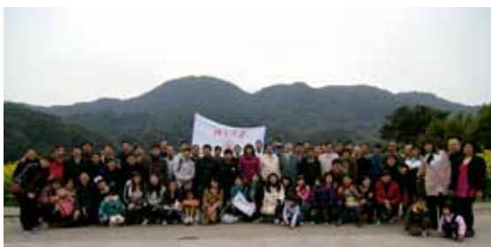
▲ 从化石门国家森林公园春游踏青合影

2011年3月19日，北大广州校友会组织约100名校友及家属从化石门国家森林公园春游踏青。校友报名异常热烈，反响良好。