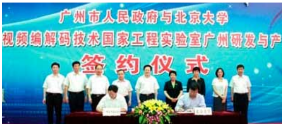
▲ 高文院士引领下的AVS广州中心之腾飞发展

2012年6月，广州市与北京大学签订的《广州市人民政府、北京大学全面合作框架协议》中再次明确指出：广州市继续重点支持“AVS广州中心”建设，推动AVS产业化，推进数字视频领域全面合作。