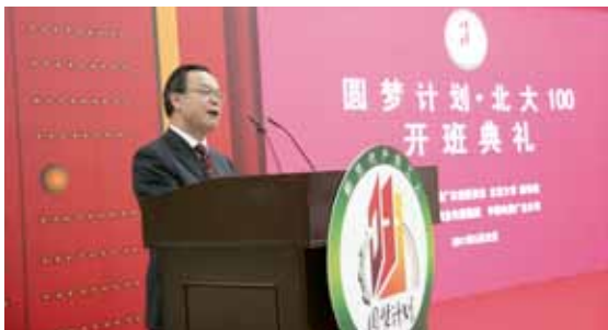
▲ 周其凤校长在圆梦计划开班典礼上致辞

以“北大100”项目为蓝本，共青团广东省委着力打造可复制推广的“圆梦100”标准化模式，建立“新生代产业工人圆梦计划联席会议”工作制度，省委分管领导朱明国同志担任召集人，各地市依省级标准建立相应机构，在教育部职成教司的指导下，对“圆梦计划”项目的生源发动与招生录取、经费筹集、激励机制等9大标准化设计进行改革，逐步完善推广。2012年广东省政府工作报告明确将“资助一万名优秀外来务工人员入读高等学校”列为省十件民生实事的第九件“改善外来务工人员工作生活条件”的重要内容之一，充分体现了对“圆梦计划·北大100”项目复制推广的肯定与支持。