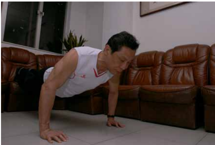
▲ 2009年，钟南山院士工作时候坚持锻炼